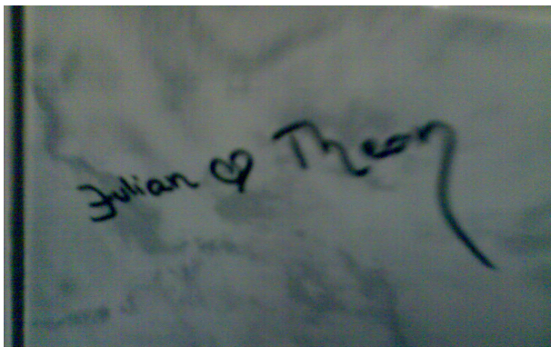
Lovexin rumpali <3 solisti YO-talon vessassa

Lähteet: Sähkötalonaulan suuri vessa ja yläkerran pienempi vastaava. Konetalon kauhea kakkalaitos. Mahtava mielikuvitus ja mututuntuma.