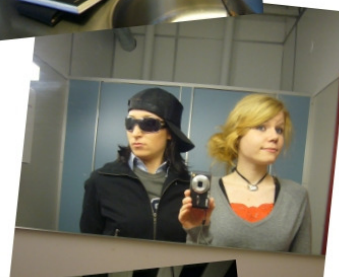
4. Sähkötalon yläkerta