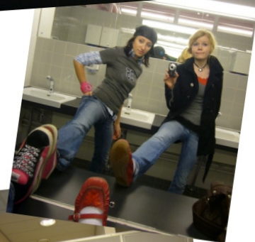
2. Sähkötalon aula